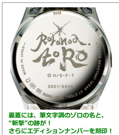
裏蓋には、筆文字調のゾロの名と、 “斬撃”の跡が！ さらにエディションナンバーを刻印！