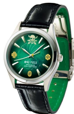
ブラックの革ベルトバージョン はクロコ調型押し牛革製。ベルト の裏側は鮮やかなグリーン。