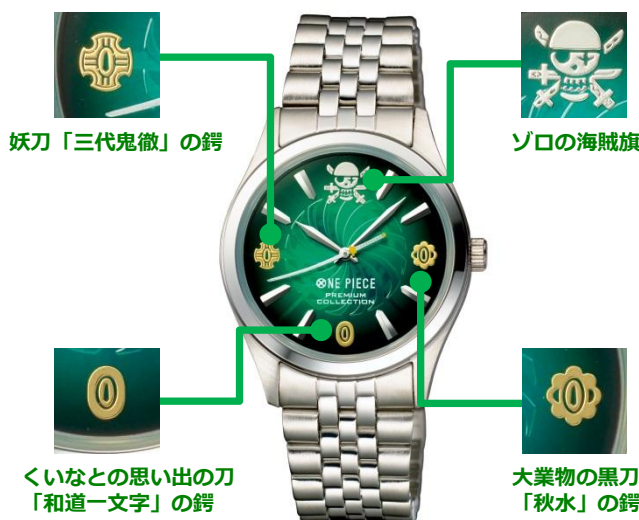
妖刀「三代鬼徹」の鏢