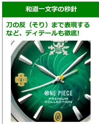
和道一文字の秒針