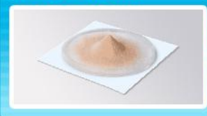
▼ラクトフェリン粉末

ラクトフェリンは、鉄と結合しやすい特性から赤みがかかった色をしており、1939年にデンマークの研究者により、乳中の赤いタンパク質として初めて報告され、乳(ラクト)中の鉄結合物質(フェリン)であることからその名前がつけました。