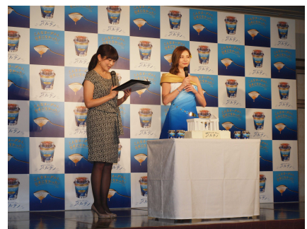
パルテノン神殿型ケーキ登場時の様子