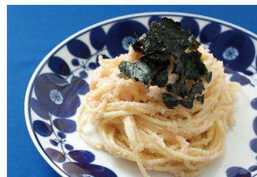
レシピ・料理スタイリング 料理家山脇に