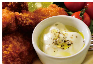
ギリシャヨーグルトのオリーブオイルディップ