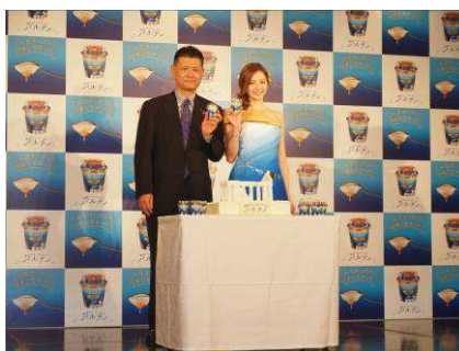
フォトセッションの様子