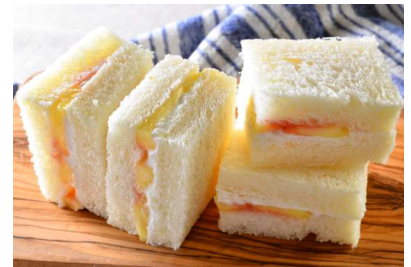
パルテノ フルーツサンド

パンにヨーグルトを塗り、ラズベリーソースをかけ、 薄くカットしたパイナップルを並べてもう1枚のパンではさみ、なじませます。