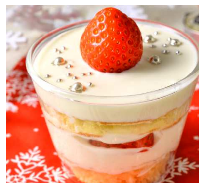
パルテノのグラスケーキ

1.クリームチーズは室温に戻します。ホットケーキは、グラスの底の大きさに合わせて6枚用意します。いちごは飾り用に3個残し、残りは厚さ3等分に切ります。 2.ボールに濃厚クリームの全材料を入れてよく混ぜ合わせます。 3.グラスにホットケーキ、②、切ったいちご、ホットケーキ、②の順に重ね、飾り用のいちごをのせ、お好みでアラザンをトッピングします。