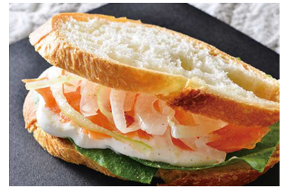
サーモンオニオンサンド

パンにサラダ菜を敷き、パルテノを塗って塩こしょうをふります。 スモークサーモンと薄切りにした玉ねぎをのせ、 もう1枚のパンではさんでなじませます。