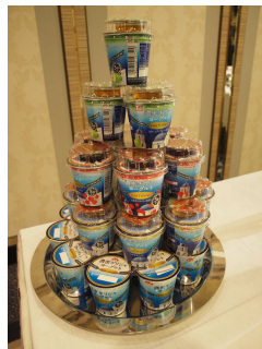
パルテノ商品展示風景