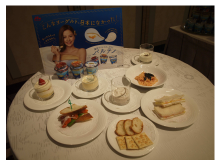
パルテノレシピ展示風景