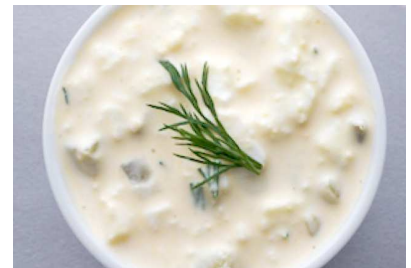
レシピ・料理スタイリング 料理家山脇に

フォークで細かくつぶしたゆで卵1個分、刻んだディル1本分、 パルテノプレーン大さじ3、塩小さじ1/4を混ぜる。