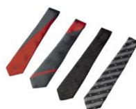
ネクタイ (4種類) 10,000円