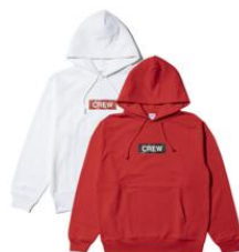
パーカー (2種類/M・L・XL) 9,000円