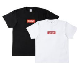
Tシャツ (2種類/M・L・XL) 5,000円