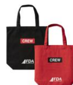
トートバッグ (2種類) 4,400円