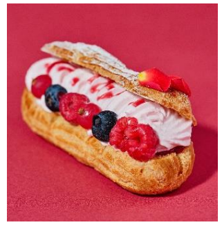
＜KIOI ROSE GARDEN（昨年の様子） & KIOI ROSE EXHIBITION イラスト 一例 & 『KIOI ROSE WEEK 2022』関連メニュー 一例＞