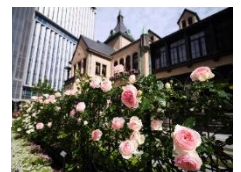
KIOI ROSE GARDEN （昨年の様子）

パリで行われている古本市をイメージした児童書シェアスポットが登場。自由に本を読んだり、お持ち帰りいただける他、不要になった児童書を寄贈すると、海外の子どもたちへの寄付活動に参加できます。