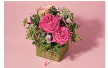
ROSE BOX アレンジメント（イメージ）