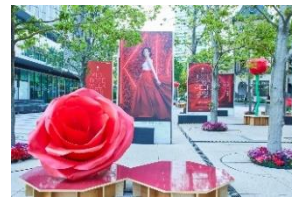
BIG ROSE BENCH (過去開催の様子)