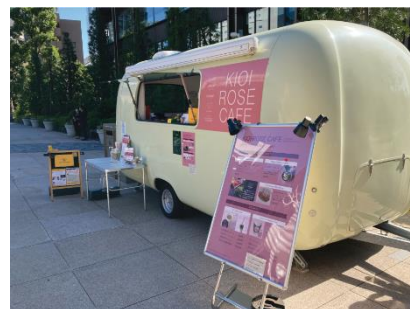
KIOI ROSE CAFE (過去開催の様子)