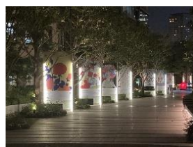
KIOI ROSE EXHIBITION (過去開催の様子)