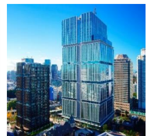
東京ガーデンテラス紀尾井町