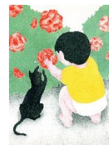
KIOI ROSE EXHIBITION イラスト 一例