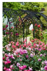
KIOI ROSE GARDEN (過去開催の様子)