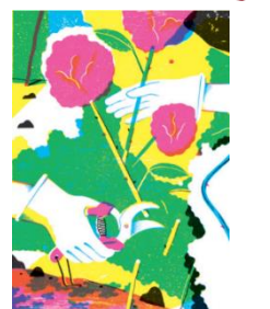
KIOI ROSE EXHIBITION イラスト 一例

都心でありながら、約 90 品種・600 株のバラが楽しめる「KIOI ROSE GARDEN」。その周辺では、古くからバラが根付く国・フランスにある児童書イラストレーター団体とコラボレーションしたイラスト展を開催。バラをテーマとした、ここでしか見ることができないイラストを鑑賞いただけます。また「KIOI ROSE CAFE」では、毎年ご好評いただいている「マルガージェラート」によるバラをイメージしたオリジナルジェラートなどを提供します。