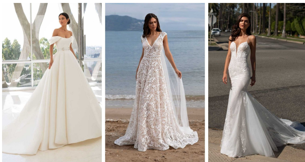
▲写真はすべてPRONOVIASのウェディングドレス

「PRONOVIAS (プロノビアス)」は、ボディラインを美しく見せるパターンのクオリティの高さと、オリジナルレースの美しさで、世界中のセレブに長年愛され続けているブランドです。王道からトレンドをおさえたデザインまであり、選ぶ段階から気分が華やぐラインナップが魅力です。上品で洗練されたPRONOVIASのドレスはまさに、ウェディングという特別な日に最適な一着と言えます。