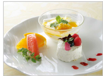
玻璃 青山 (料理イメージ)

「玻璃 青山」は、東京都南青山に店舗を構え15年の歴史を持つグローバルチャイニーズレストラン(※現在、リニューアルのためクローズ)。伝統的な広東料理をベースに、和、イタリアン、フレンチの技法などを取り込んだ新感覚の中国料理です。