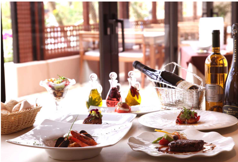
リストランテ グランマーレ (料理イメージ)

株式会社南西楽園リゾート(本社:東京都港区)が運営する沖縄県宮古島市、約100万坪の敷地を誇るリゾート「南西楽園」は、グローバルチャイニーズ「玻璃 青山」と、高級イタリアン「リストランテ グランマーレ」の2店舗を、2013年3月20日(水・祝)にオープンいたします。