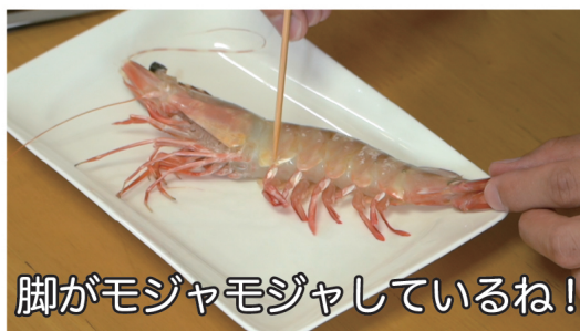
脚がモジャモジャしているね!