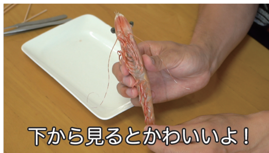
下から見るとかわいいよ!