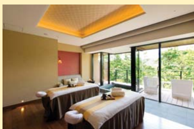
フォレスト・スイート イメージ

美しい樹冠の見晴らしをご堪能いただける「フォレスト・スイート」で極上のスパ体験をおふたり一緒にお楽しみいただけます。