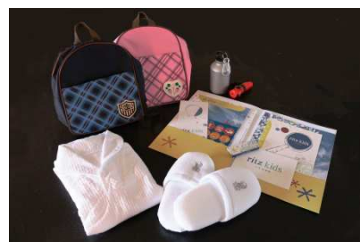
アイテムイメージ