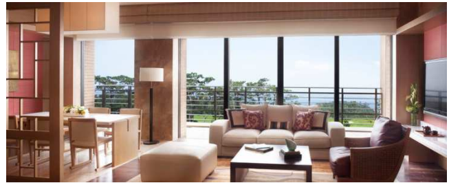
ザ・リッツ・カールトンスイートイメージ

ザ・リッツ・カールトン・ホテル・カンパニーはリッツ・キッズ@プログラムを2013年12月からスタートいたしました。小さなお子様にも、教育、文化、アドベンチャーそして未来の地球環境の意識を高めることなどを通じ、通常のホテル滞在とは一味違う、思い出に残る、魅力あふれる、そして夢中になれるご体験を提供しております。