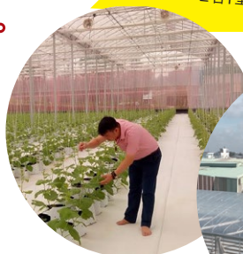
日本式の施設園芸 栽培を徹底サポート。