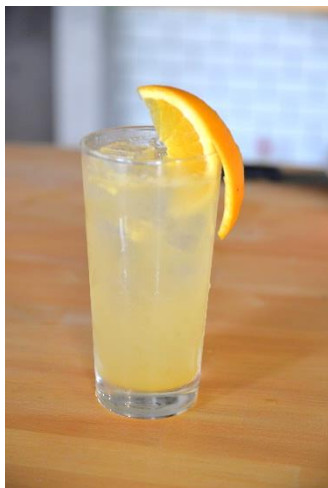
オレンジ ¥ 700