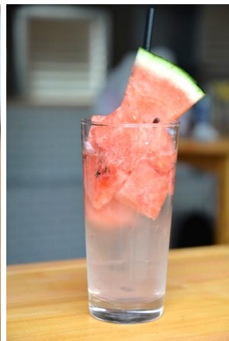
スイカ ¥ 700