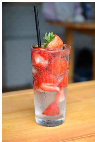
まるごとストロベリー ¥ 1000