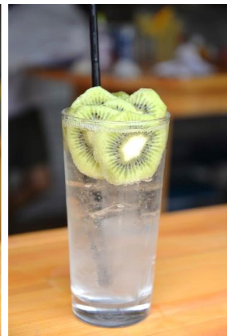
キウイ ¥ 700