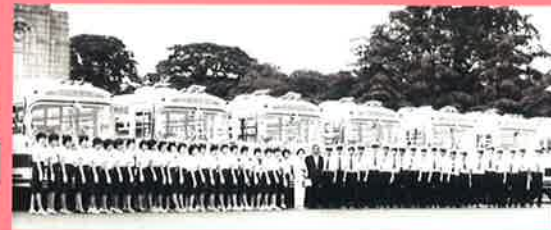
日の丸自動車興業株式会社は 昭和38年に誕生しました。

● お問い合わせ (9:30~18:00)スカイバスコールセンター TEL:03-3215-0008