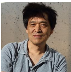
池上 高志氏 (東京大学大学院 教授)