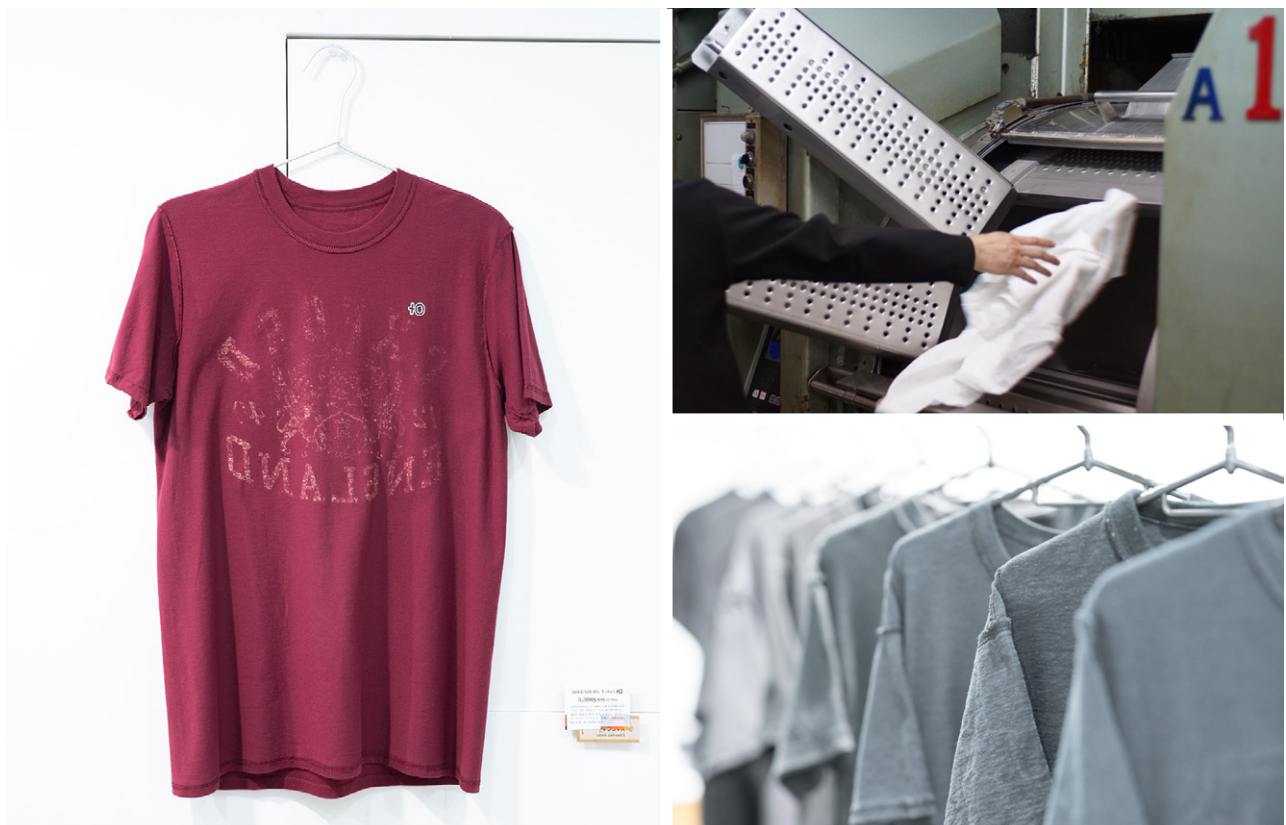
写真左：ROLE YOURS の商品。『+0』のワッペンを胸のワンポイントに。右上：工業用のマシンで抗菌加工 右下：Tシャツの表裏を裏返しに加工。

『生地』段階での抗菌加工やその他機能的な付加はこれまでの繊維業界では珍しくなかったものの、古着への二次的な後付け加工はこれまでに前例がありません。さらに、赤ちゃんの服の構造から着想を得た『服の表裏をひっくり返し、縫い目を外側に』することで、肌あたりが滑らかになり、着心地の良さをサポートします。つまり、足しているようで足していない。作っているようで、作っていない服なのです。