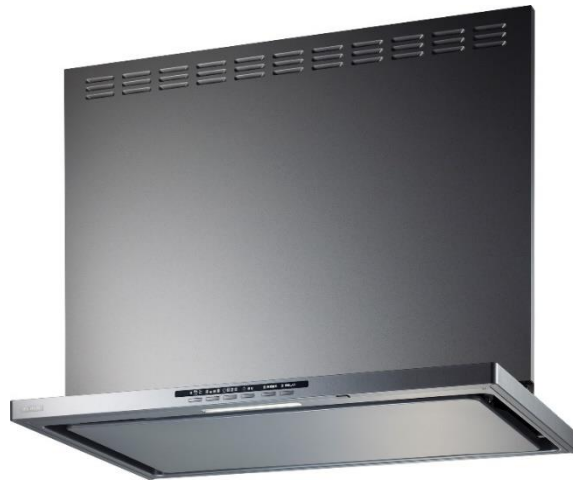
「SERL-ECE」シリーズ イメージ

富士工業グループは、レンジフード国内トップシェアメーカーです。(OEM生産品を含む) FUJIOHは、富士工業グループの企業ブランドです。