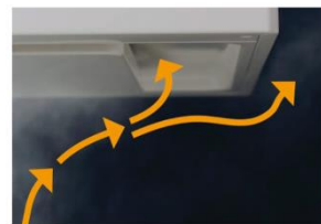
調理状況にあわない風量での運転時