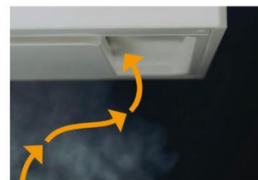
調理状況にあった風量での運転時