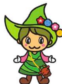
イメージキャラクター 「たなだまいちゃん」