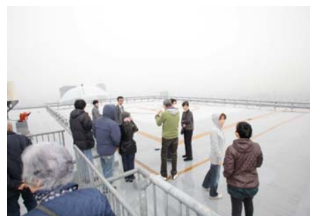
普段は入れない屋上ヘリポートを見学