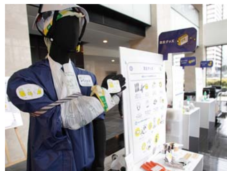
防災グッズを見て触れるエントランスの展示

イベントでは、マンション居住者様が家具転倒防止や食品の備蓄など普段からできる備えをご紹介します。また、参加者同士で応急手当を体験していただいたワークショップでは、 「災害時マンション居住者で助けあう必要性をあらためて感じた」というお声を参加者の方からいただきました。