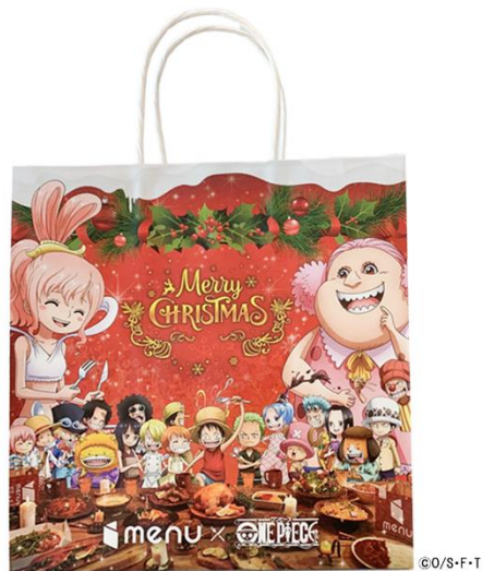
「ワンピース」×menu クリスマス限定オリジナル紙袋

※クリスマス限定オリジナル紙袋は各店舗の上限に達し次第終了となりますので、ご了承ください。