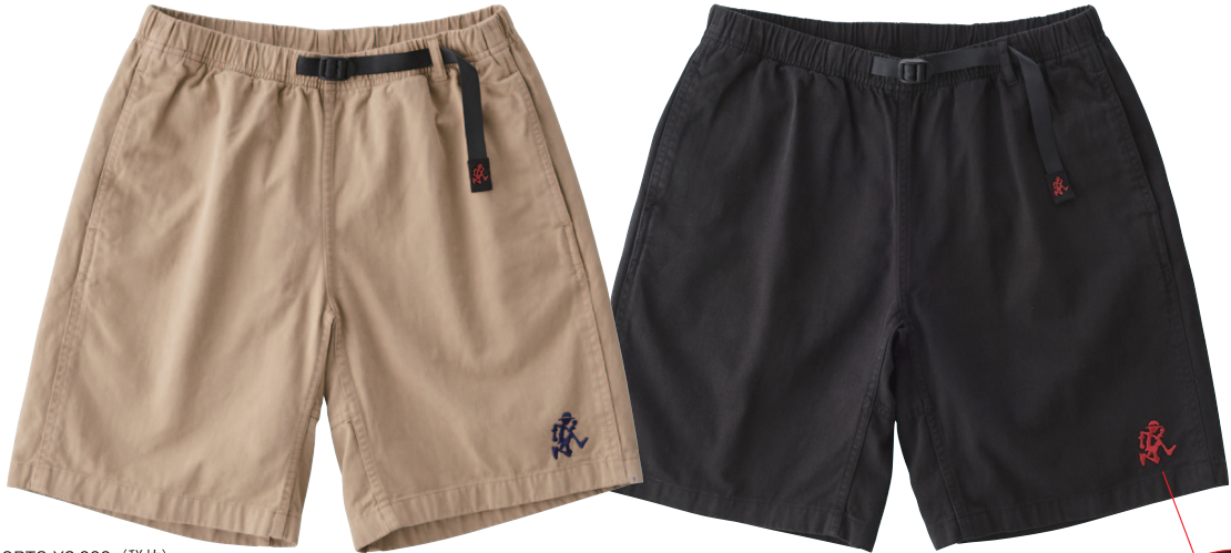
ONE PIECE G-SHORTS ¥8,000 (税抜)