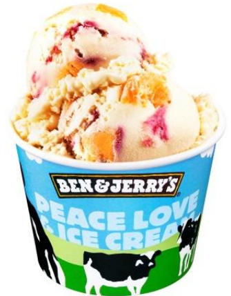
【ピーチ パーティー】