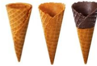
(左)コーン、(中央)ワッフルコーン、(右)チョコレートワッフルコーン