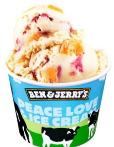
【ピーチ パーティー】

今後もBEN&JERRY'Sでは、地元の皆様に愛されるショップづくりにじっくりと取り組みながら、新店舗を展開していく予定です。