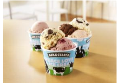
(左奥)スモール、(中央)レギュラー、(右奥)ラージ