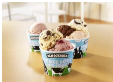
(左奥)スモール、(中央)レギュラー、(右奥)ラージ