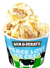
【先行発売する新フレーバー】

今後、BEN&JERRY'Sでは、地元の皆様に愛されるショップづくりにじっくりと取り組みながら、2013年にも新店舗を展開していく予定です。