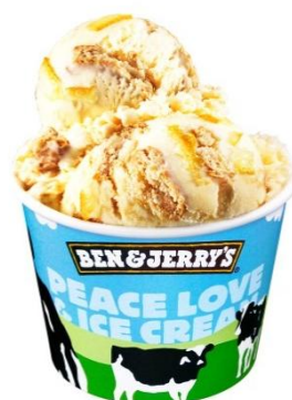
ユズ シトラスキス