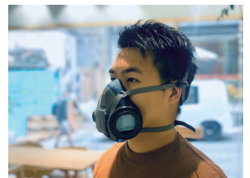
3D プリンターで制作されたコロナウイルスに対するマスク

URL: https://awrd.com/award/mask-design-challenge