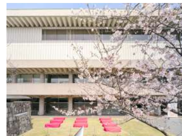
10.前庭のお休み処