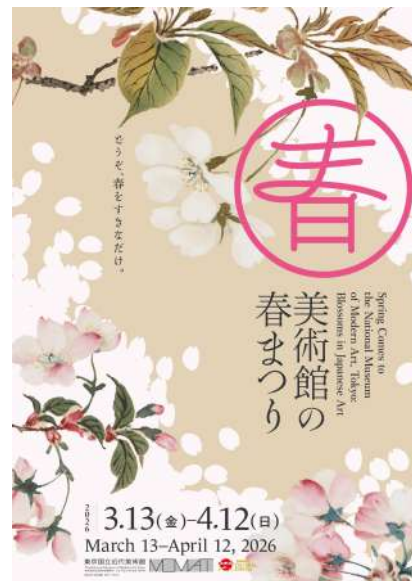
01.「美術館の春まつり」ポスター

「MOMAT コレクション」では、およそ 14,000 点の所蔵作品の中から選りすぐりの約 200 点を、12 の展示室ごとにテーマをもうけてさまざまな切り口でご紹介します。各展示室に点在する花を描いた作品を探しながらの鑑賞もおおすすめです。