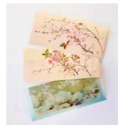
03.チケットファイル