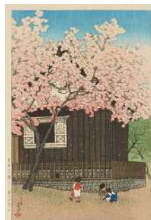
15.川瀬巴水 「東京十二題」より 《春のあたご山》1921 年