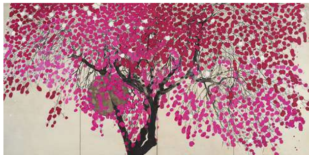
14.船田玉樹《花の夕》1938 年