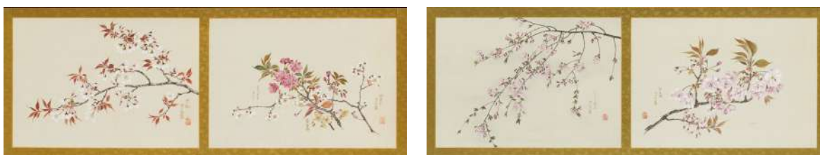
跡見玉枝《桜花図巻》1934 年 07.左 08.右