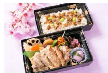
02.特製お花見弁当イメージ

春まつり期間中に限り、《行く春》等の期間限定デザインのカードをご用意しています。