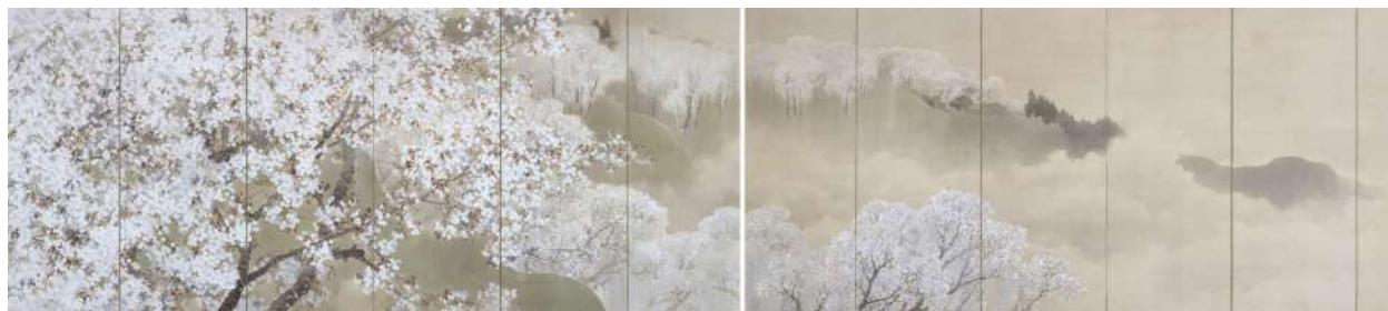
菊池芳文《小雨ふる吉野》1914 年 11.左隻 12.右隻 13.全図