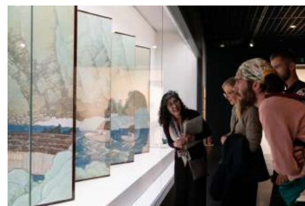
09.春まつりイベントイメージ