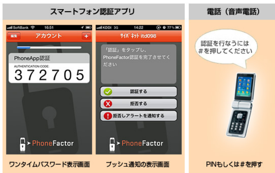
複数の手段で多要素認証を提供する PhoneFactor

今回リリースする新バージョンは、「スマートフォン認証アプリ」に OATH 準拠の時刻同期方式ワンタイムパスワード発行機能(TOTP ※2)を追加いたします。本機能により発行されるワンタイムパスワードは30秒毎に更新される「使い捨て」のパスワードになります。30秒毎に新たなパスワードが発行されるため、パスワード類推の危険性が非常に低く、パスワードが漏洩した場合でも30秒後には無効になるため非常にセキュリティレベルの高いソリューションとなっております。なお、スマートフォン認証アプリは iOS 3.2 以上、Android OS 2.2 以上に対応しております。