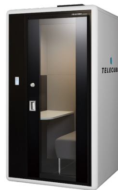
▲テレキューブ by OKAMURA

三菱地所とブイキューブは2018年11月20日（火）～2019年7月31日（水）の間、東京・丸の内エリアにおけるオフィスビル3物件の共用部への「テレキューブ」設置を皮切りに、順次エリアを拡大し計9物件22台を設置し、多くのワーカーにご利用いただくことを通じて、本製品を活用した働き方改革推進のための実証実験を行いました。その結果、①個人・法人双方での一定の申込・利用実績による、「テレキューブ」という新しいテレワークの在り方に対する潜在的ニーズの存在の確認、及び②新会社のオペレーションの検証と課題の抽出を達成しました。実験開始当初より「テレキューブ」設置および課金モデルによる事業化を視野に入れておりましたが、今後は、より広範囲への設置拡大を通じた利便性向上を達成すべく、今般の新会社設立に至りました。