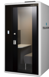
▲テレキューブ by OKAMURA