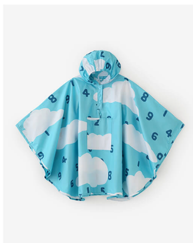
キッズレインポンチョ SO-SU-U と雲 ¥2,990(税込)