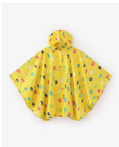
キッズレインポンチョ SO-SU-U 昆(こん) ¥2,990(税込)

京都のテキスタイルブランド「SOU・SOU」(代表取締役：若林剛之)と、台湾セブン - イレブンのコラボレート第4弾に、キッズのレインウエアが登場。SOU・SOUを代表するテキスタイルデザイン“SO-SU-U”をポップに散りばめたカラフルなキッズ用のレインポンチョは、着脱しやすい上に、折り畳んでポケットサイズに収納も可。直径約80cmの小ぶりな洋傘は、かわいいネームタグ付き。日本では、SOU・SOUのネットショップと、実店舗『SOU・SOU わらべき』『SOU・SOU KYOTO 青山店』のみで購入可能(日本のセブンイレブンでは取り扱いがありません)。