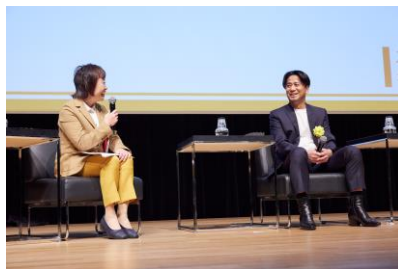
トークセッションの様子