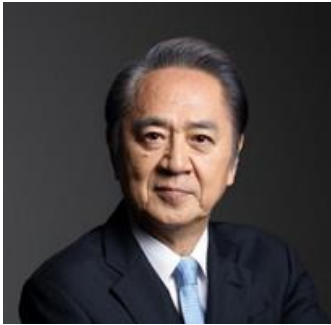
横須賀市長 上地 克明 氏