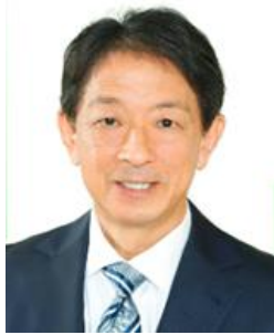
美浜町長 八谷 充則 氏