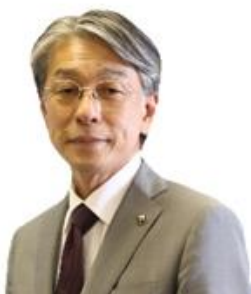
田辺市長 真砂 充敏 氏