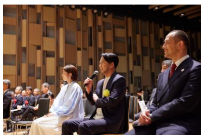
スポーツ・健康まちづくりデザイン学生コンペティション2023の様子