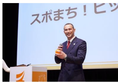
スポまち！ピックアップの様子

〈本資料に関する報道関係者様からのお問い合わせ先〉「スポまち！長官表彰2023」運営事務局