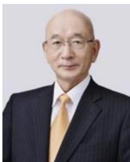
萩市長 田中 文夫 氏