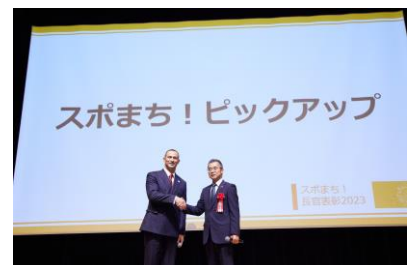
スポまち！ピックアップの様子