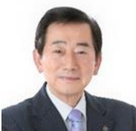
藤枝市長 北村 正平 氏