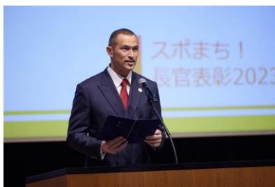
室伏長官による開式挨拶の様子