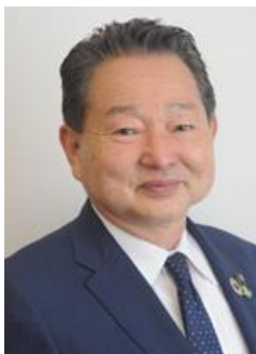
東御市長 花岡 利夫 氏