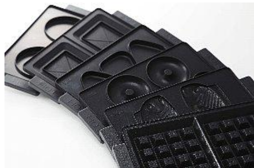
6種類のオプションプレート