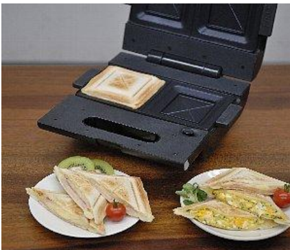
モテナシベーカー

石崎電機製作所では、男前アイロンと同様に、長く使い続けていただけるホットサンドメーカーを目指し、壊れにくいシンプル(しかし高性能)なホットサンドメーカーとなっております。そして交換部品の保有法定年数(5年間)を過ぎても、部品のある限り修理を続けさせていただきます。また、部品が欠品した場合でも、石崎電機製作所の技術で対応できるものに関しては、修理をさせていただきます。