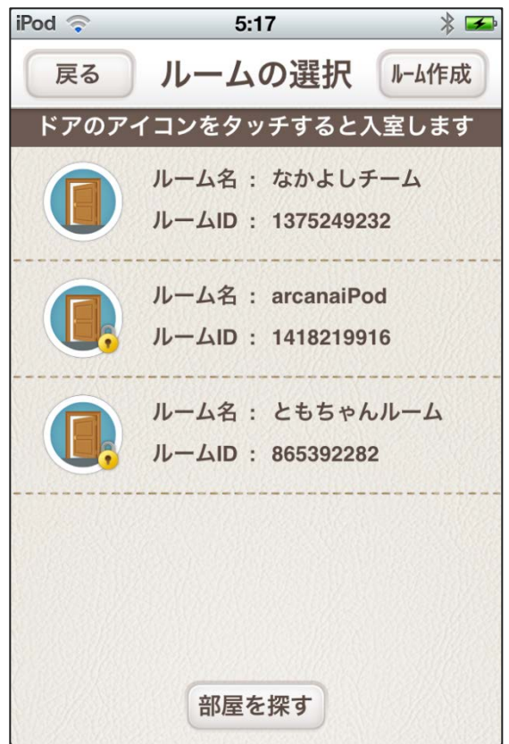
通信エリア内ユーザーの端末を自動サーチ