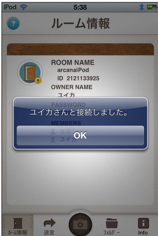
接続先を選ぶだけで簡単に同期がとれます