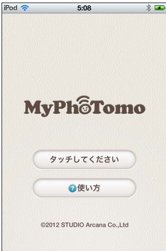
タイトル画面です。