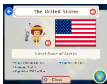
言語切替で英語版も楽しめる

※SoftBank およびソフトバンクの名称は、日本国およびその他の国におけるソフトバンク株式会社の登録商標または商標です。 ※ Android は、Google Inc の商標または登録商標です。