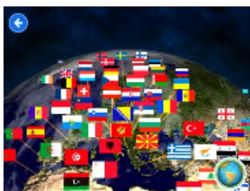
193カ国を網羅した「まわるちきゅうぎ」

本アプリではパスポートとして最大3人のプレーヤーを登録可能。パスポートには、名前や顔写真が登録できるほか、3色から気に入った色のスーツケースを選択し、パズルやクイズで入手したご褒美をコレクションすることもできます。兄弟で競い合ったり、親子で世界の国々について話し合ったりと、本アプリを通じたコミュニケーションをお楽しみください。