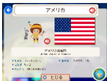
各国の詳細情報や挨拶ボイスも搭載