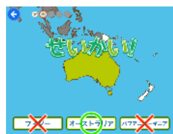
クイズやパズルで楽しく学習