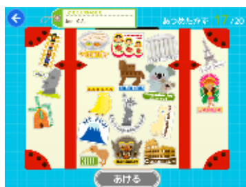
楽しく学べる仕掛けがいっぱい