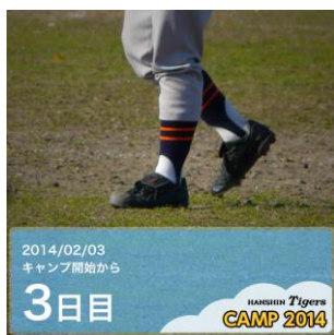
キャンプフレーム

「トラカメラ」は、あらかじめ用意されたフォトフレームを、スマートフォンのカメラで撮影した写真と合成し、画像として保存することや、SNS などに投稿できる機能を備えたカメラアプリです。7つのテーマに分類された約50種類ものフォトフレームを使い、人物写真や自撮り写真、なにげない日常の風景と合成することで、特にタイガースファンならうれしい面白ネタ画像をすぐに作り出せます。その場で撮影した写真のみならず、端末に保存している写真を使うことも可能で、シチュエーションを問わずお楽しみいただけます。