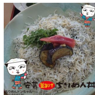
ご当地キャラフレーム(安芸)