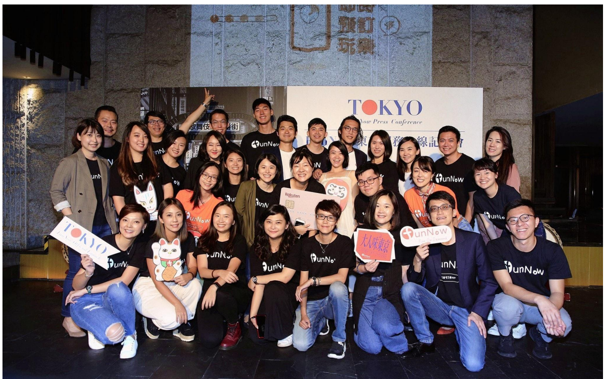
FunNow 現在世界中における社員数 70 人、人材募集中。