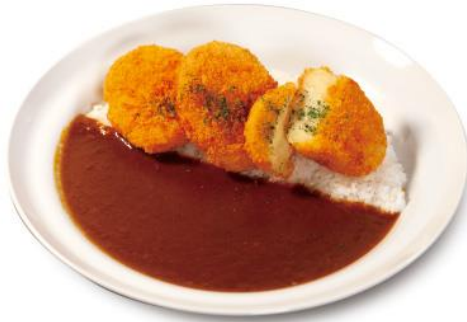
ポテトコロッケカレー 通常価格 550円 税込 → 500円 税込