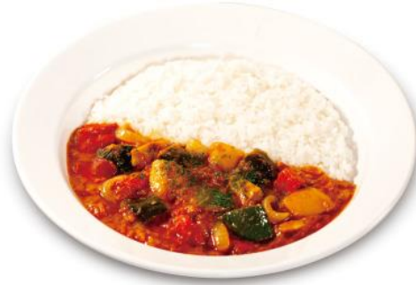
ラタトゥイユカレー 通常価格 530円 税込 → 500円 税込