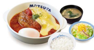
たっぷりソースの チーズうまトマハンバーグ 定食 930円