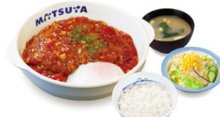
たっぷりソースの うまトマハンバーグ 定食 750円