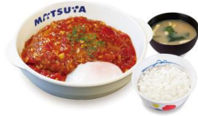
たっぷりソースの うまトマハンバーグ ライスセット 690円