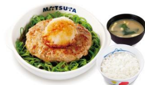
おろしポン酢ハンバーグ ライスセット 720円