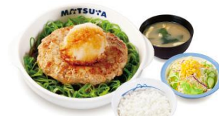
おろしポン酢ハンバーグ 定食 780円