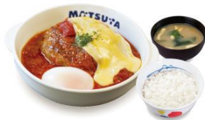
たっぷりソースの チーズうまトマハンバーグ ライスセット 870円