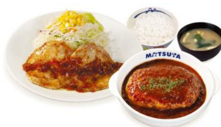
チキン盛合せ デミグラスソース ハンバーグ定食 1,130 税込 円