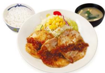
チキン定食肉 3 枚 680 税込 円