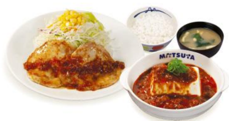
チキン盛合せ 富士山豆腐の本格 麻婆定食 890 税込 円