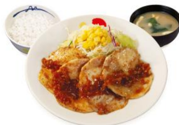
チキン定食肉 4 枚 780 税込 円