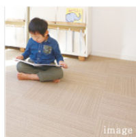
TEXTILE FLOOR ROOM