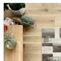
OVER 17.5J LDK