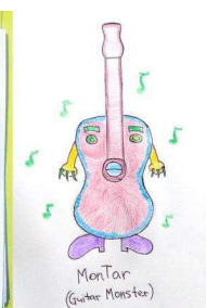
ユーザー投稿により作成されたキャラクター

DEA は本プロジェクトを通じ、誰もがクリエイターになることの出来る社会の実現を目指し、世界中のユーザーに様々なコンテンツを通して“楽しさ”と“驚き”を提供するため、Web3 時代の IP 創出の在り方を模索してまいります。