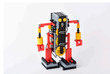
* 作例ロボットイメージ