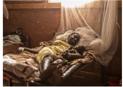
MSF の病院に入院する母子