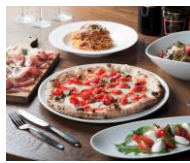
SALVATORE CUOMO & BAR