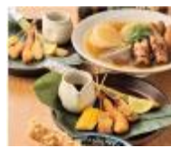
釜たけ流うどん 一寸一杯