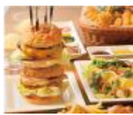
THE BEAT DINER