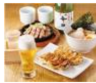
餃子と炙り こけごっこ