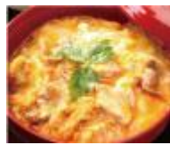
鶏とちよこつと料理 ほっこりや