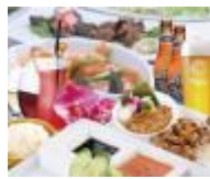
シンガポール 海南鶏