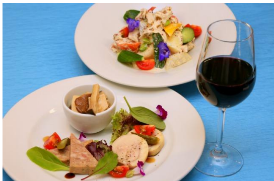
ラ・カンパーニュ（大手町カンファレンスセンター）

フード：大地のハーブ鶏と季節野菜のゴロツとサラダ/ 大山どりのバロンティーヌと自家製おつまみ 2品の盛り合わせ