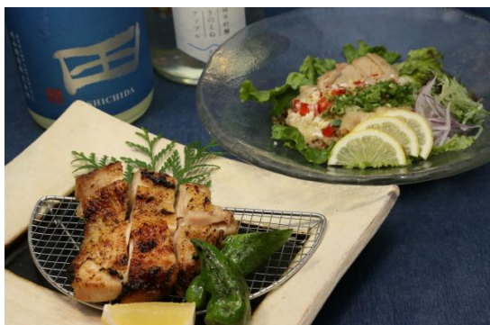
虎連坊 大手町（大手町ファーストスクエア）

ドリンク：生ビール / ソフトドリンク各種 ※ カレーの場合はソフトドリンク各種のみ