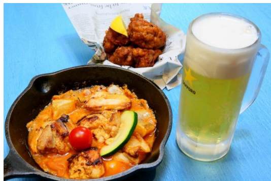
野菜を食べるカレーcamp（大手町タワー（OOTEMORI））

ドリンク：生ビール(キリンハートランド)/グラスワイン (赤/白) /ハイボール/フレンチソーダ（ノンアルコール） /ウーロン茶