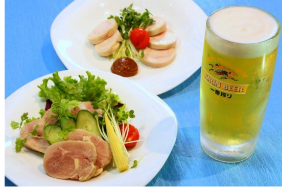
Bistro エビ キング (大手町フィナンシャルシティショップ&レストラン)