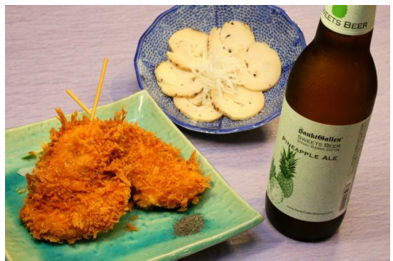
UOMAN DINING 日本酒バル さわら (日本生命丸の内ガーデンタワー)

フード：大山どりもも肉と万願寺ししとうの柚胡椒炒め／大山どりもも肉のとろとろ冷し鶏／大山どりもも肉と根菜の治部煮