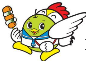
鳥取県「とつと Rich キン」