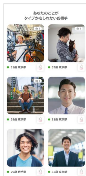
▲ マッチング率高いお相手紹介