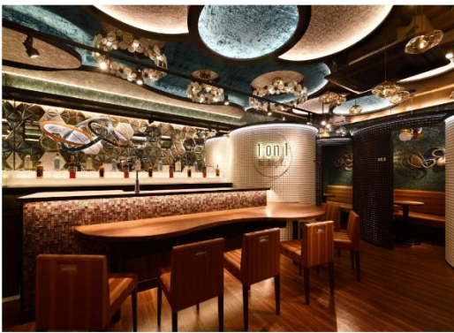
高級感漂うプレミアムな空間で恋活を楽しめる新宿本店

「1on1 for Singles」は、新宿と恵比寿の2店舗展開をしています。2024年12月14日には上野店がオープン予定です。