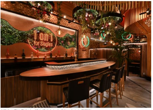
2号店の恵比寿店は、緑を感じられるボタニカルな雰囲気