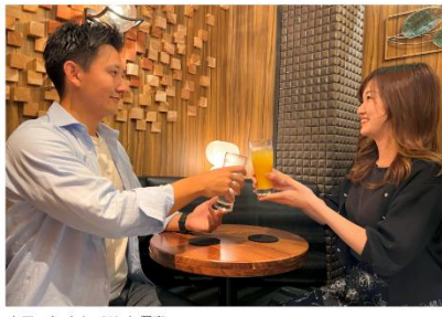
カフェをイメージした個室