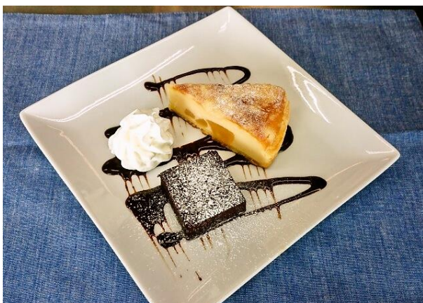
セガフレード・ザネッティ・エスプレッソ (原宿クエスト)

提供メニュー：ささしぐれこだわりの3貫(秘伝のづけ鮓、江戸前小肌の昆布め、活穴子ふんわり煮)