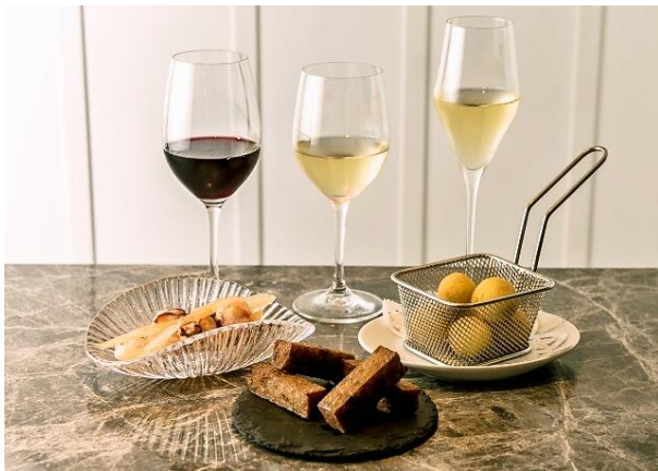
パール ア ヴァン パルタージェ (表参道ヒルズ)

提供メニュー：フォアグラのクリームブリュレ、タコとセロリのギリシャ風マリネ、ポルチーニの揚げリゾット、ハモン・イベリコベジョータ生ハムのコロッケ