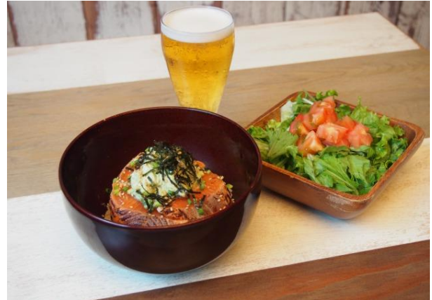
cafe STUDIO (原宿エリア)

提供メニュー：炙りサーモンとアボカド丼、イエローカレー、タコライス、揚げ物盛合せ(いずれも+グリーンサラダ)