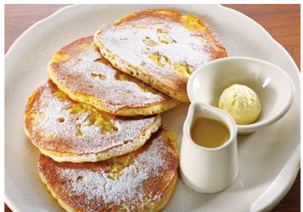
THE Original PANCAKE HOUSE (キュープラザ原宿)

提供メニュー：ドルチェプレート(リコッタチーズケーキ、ブラウニー)、フードプレート(彩り野菜のクリームニョッキソーセージ、カプレーゼ)