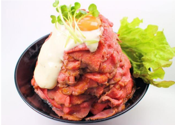
レッドロック 原宿店 (原宿エリア)