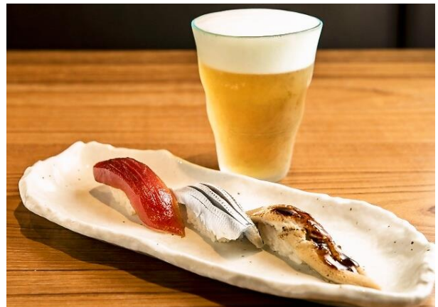
築地玉寿司 ささしぐれ (表参道ヒルズ)

提供メニュー：フォアグラのクリームブリュレ、タコとセロリのギリシャ風マリネ、ポルチーニの揚げリゾット、ハモン・イベリコベジョータ生ハムのコロッケ