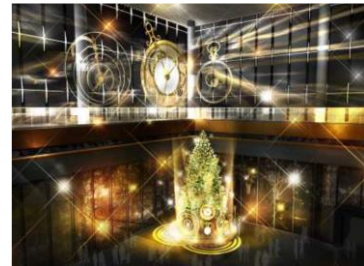
<丸ビル1階マルキューブ クリスマスツリーイメージパース>

TEL：03-4323-0100 E-mail： marunouchi@ozma.co.jp