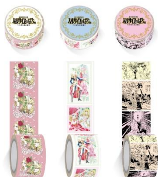
幅広マスキングテープ（全 3 種、各 770 円）

なお、会期前・会期中を問わず、購入個数制限を変更する場合があります。あらかじめご了承ください。