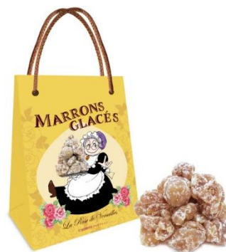
「マロンのマロングラッセ」(1,080 円)