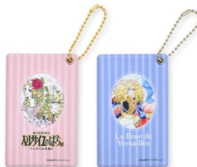
バスケース（全 2 種、各 1,650 円）