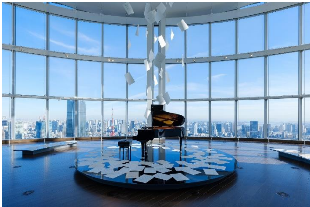
海拔 250mの高さから東京の街を一望するスカイギャラリーにユーミンがこれまでにつくってきた曲の譜面やメモなどの複製を 100 点以上ちりばめたエントランス