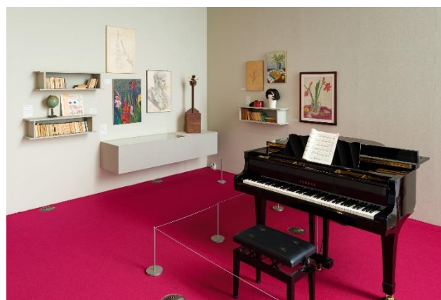
八王子で生まれ育ったユーミンの 10 代～荒井由実時代の「原点」の部屋。「夜抜け」に実際に使われていたウィッグの展示も。