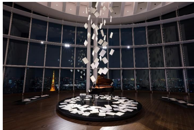
夜のエントランスの様子