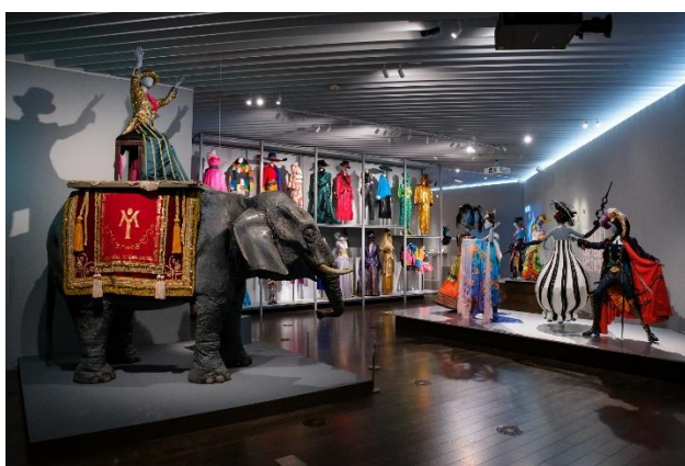
コンサート衣装の実物を 29 点展示