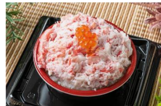
カニ丼 (税込 1,980 円)

Uber Eats (ウーバーイーツ)は、Uber が2014年に立ち上げたアメリカのオンラインフード注文・配達プラットフォームで、日本では2016年にサービスを開始しました。スマートフォンやパソコンを使用して加盟する飲食店へ出前を注文できるサービスです。