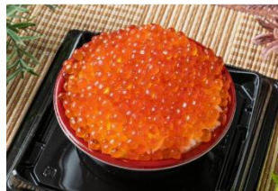
いくら丼 (税込 2,980 円)